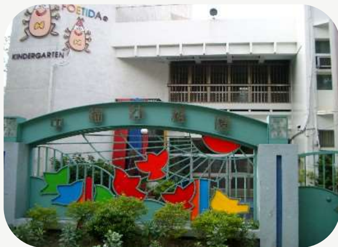
幼兒園 人資管理師徵才