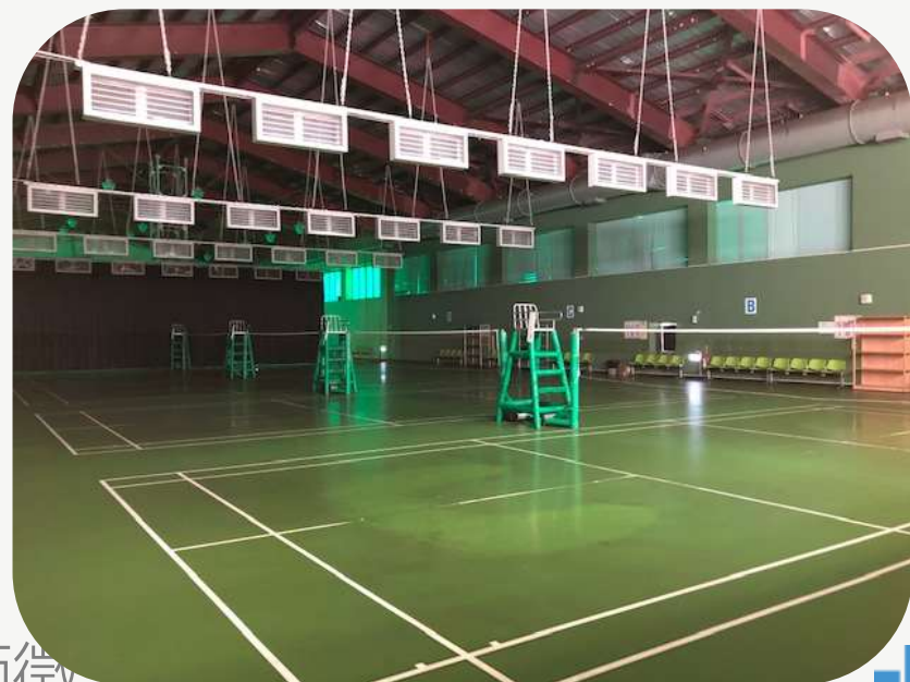
羽球場 排球場 籃球場