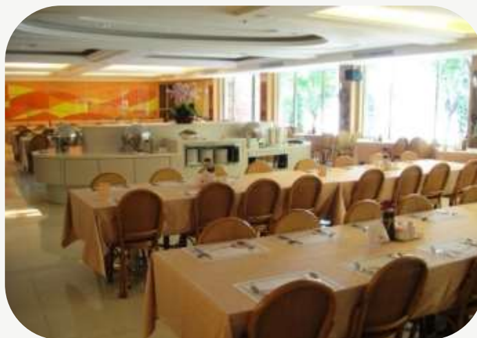
餐廳 人資管理師徵才